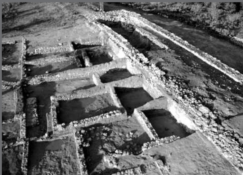
Riu-Rau del Mas del Fondo Poblat Iber del Tòs Pelat